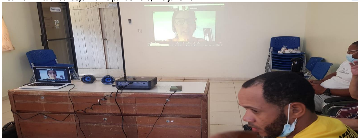
Reunión Comité de Recuperación Municipio Vicente Noble, - 16 septiembre 2021