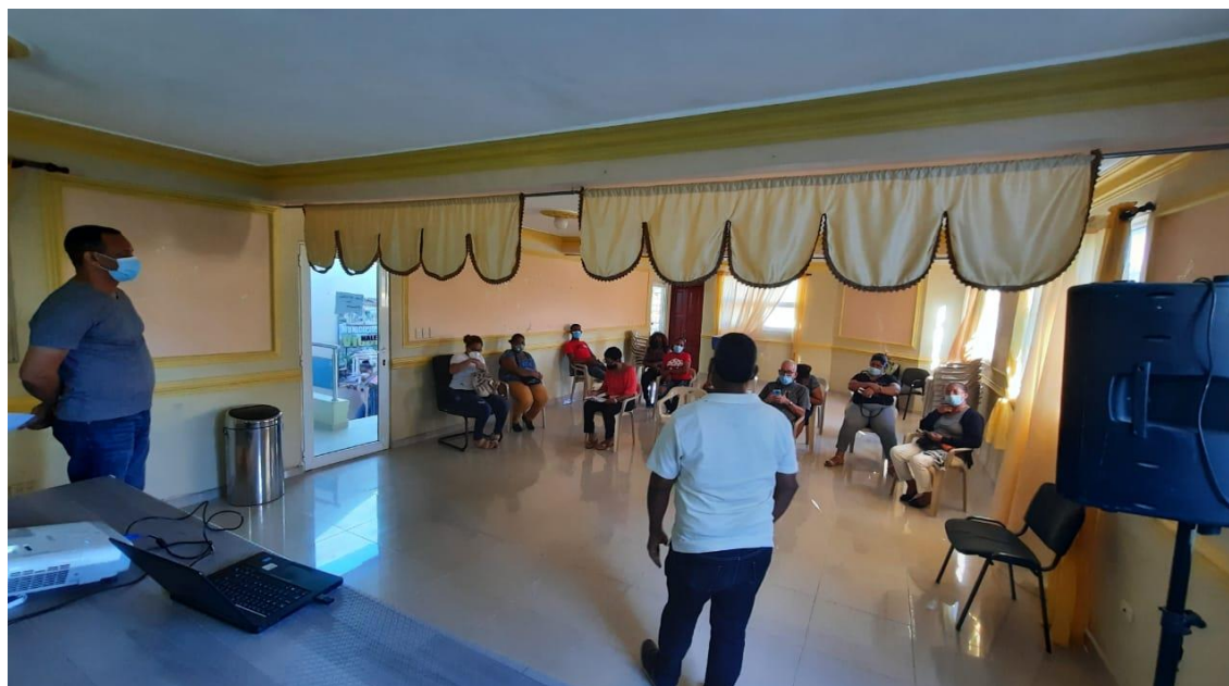
Conformación de cooperativa de mujeres artesanas del Municipio Vicente Noble, 23 noviembre 2021