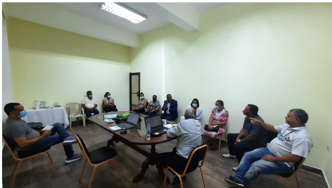
Reunión con artesanos/as de Santa y Vicente Noble Barahona, 4 de noviembre 2021